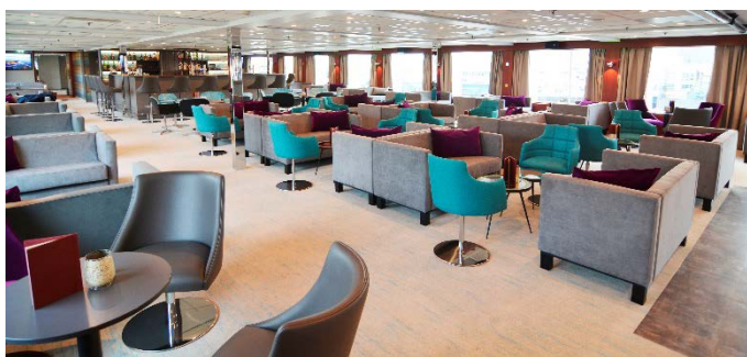
MS Nestroy, Bar/Lounge