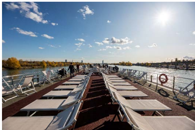
MS Nestroy, Sonnendeck

Schon am frühen Morgen erreicht das Schiff Wien. Nach einem letzten Frühstück an Bord sagen wir schließlich der MS Nestroy Lebewohl.