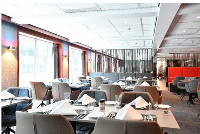
MS Nestroy, Restaurant