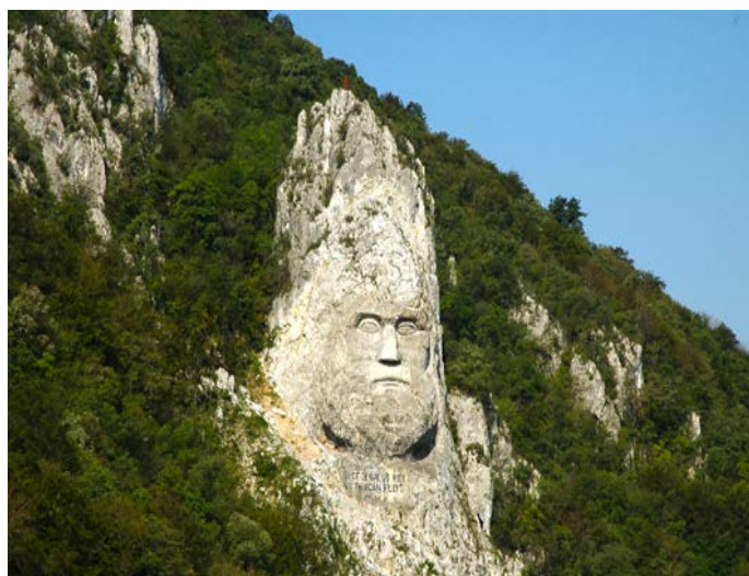
König Decebalus / „Eisernes Tor“