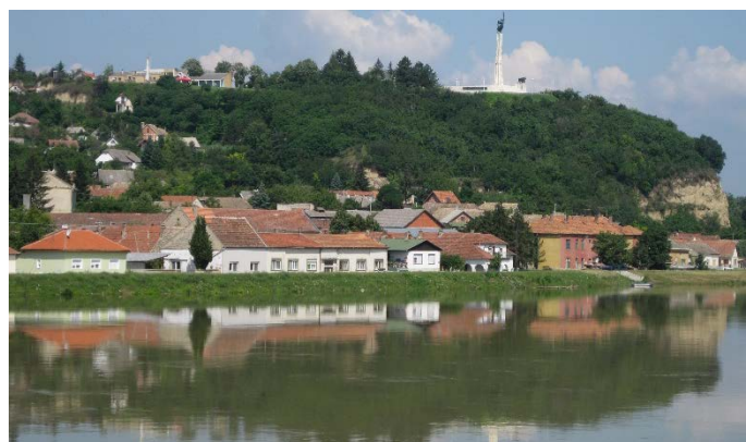
Donau in Ungarn