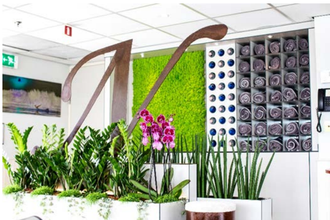
MS Nestroy, Fitnesscenter