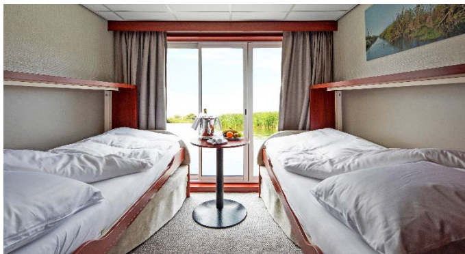
MS Nestroy, Zweibett-Kabine Schiller- bzw. Goethedeck