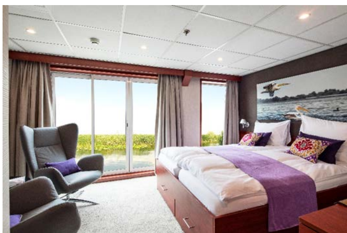
MS Nestroy, Suite Schiller- bzw. Goethedeck