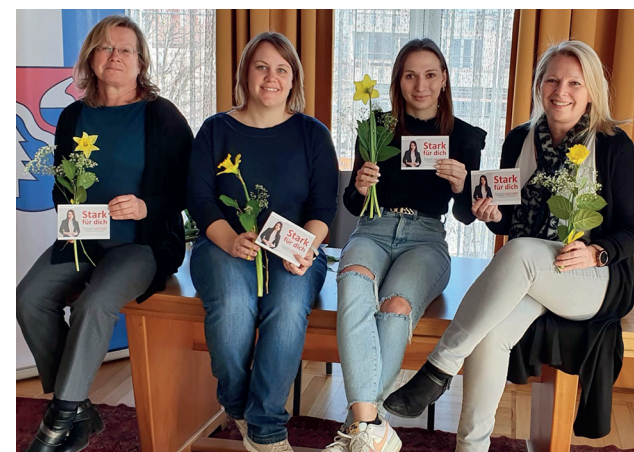
Die Kolleginnen von der Marktgemeinde Lenzing am Weltfrauentag!