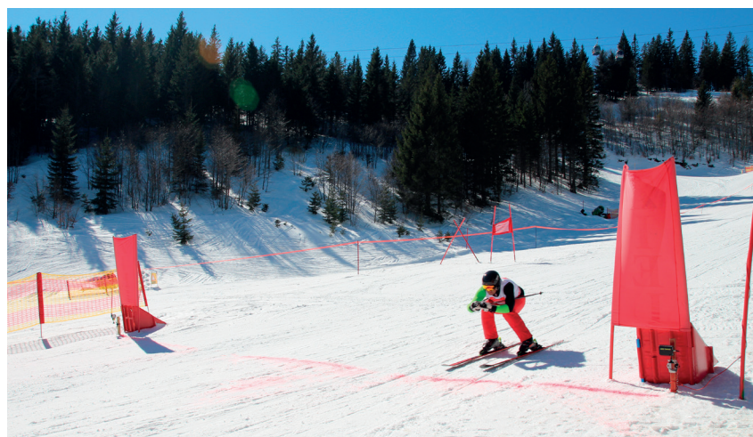
Bis zu den letzten Teilnehmer*innen wurde um die ersten Plätze gekämpft!

https://www.skizeit.at/races/37498/results/classes