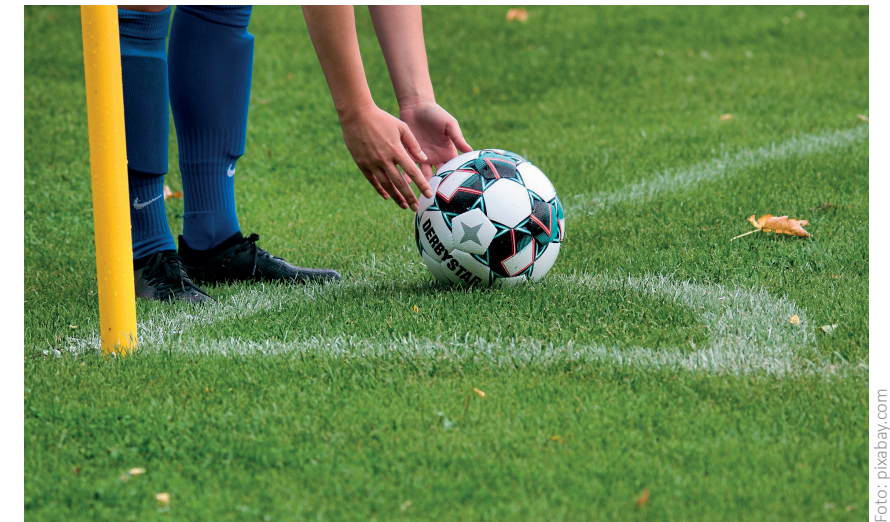
Es wird wieder viel Stimmung und Spannung bei den 5. Kleinfeld-Fußballmeisterschaften geben!

Genaue Informationen gibt es in der Ausschreibung auf unserer Homepage www.younion.at/ooe oder bei der/dem Bezirksvorsitzenden.